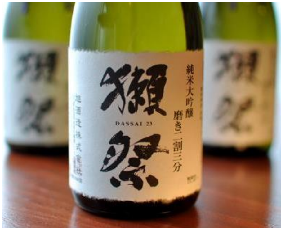
旭酒造の売上高は右肩上がり 各年9月期