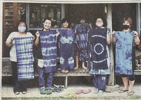
完成した藍染めはコースターに加工し、本部町制80周年記念式典で記念品として贈られる。7日、同町伊豆味の「藍め葉あ農場」

本部児童、楽しく藍染め 町制80周年の記念品制作 【本部】本部町内の子どもたちが町制80周年式典の記念品のコースターを制作するため7日、同町伊豆味の「藍め葉あ農場」(池原村漁村生活研究会の会員が幹人代表)で、助言を受け、コースターに仕立てる。作