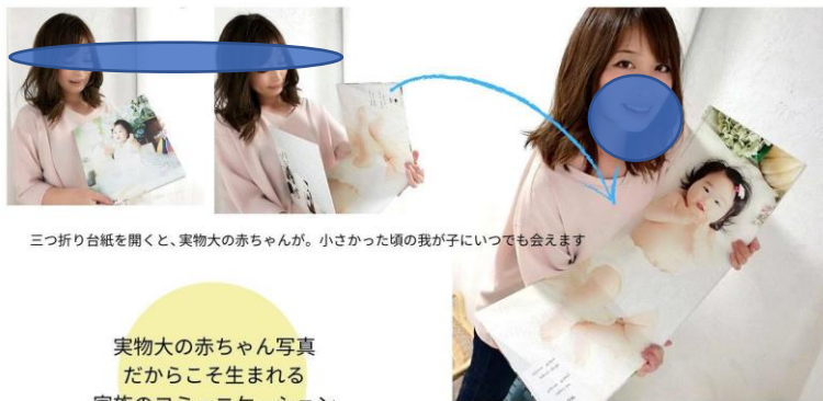
三つ折り台紙を開くと、実物大の赤ちゃんが。小さかった頃の我が子にいつでも会えます

手形や足形など、赤ちゃんの成長を残す方法は色々ありますが、かわいい「今」を実物大で残せるのが「ずっと抱っこフォト」。全国でも珍しい取り組みが、令和元年から仙台でスタートしています。これまで50人余りの赤ちゃんの赤ちゃんを撮影。対象年齢は生後12ヶ月程度までと限られています。「本当に抱っこしているみたい」等、実物大だからこそ感じられる喜びの声が寄せられています。