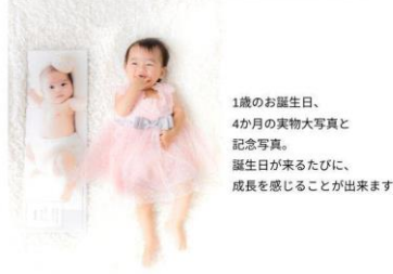
1歳のお誕生日、 4か月の実物大写真と 記念写真。 誕生日が来るたびに、 成長を感じることが出来ます