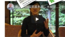
魅力の根幹をして貴力をアップしたい 旅館さんは星様♪