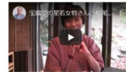
宝楽堂の早苗女将さん