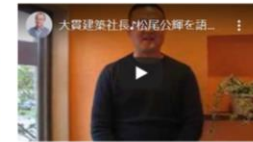
大貫建築社長と公認公理を語